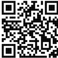
แบบคำขอแก้ไขรายการในใบรับจดแจ้งเครื่องสำอาง (แบบ จ.ค.4)

https://www.fda.moph.go.th/sites/Cosmetic/SitePages/Permission.aspx ข้อ 2.3 แบบคำขอแก้ไขรายการในใบรับจดแจ้งเครื่องสำอาง (แบบ จ.ค.4) และสามารถติดต่อได้ที่เบอร์โทร. 02-590-7273-5